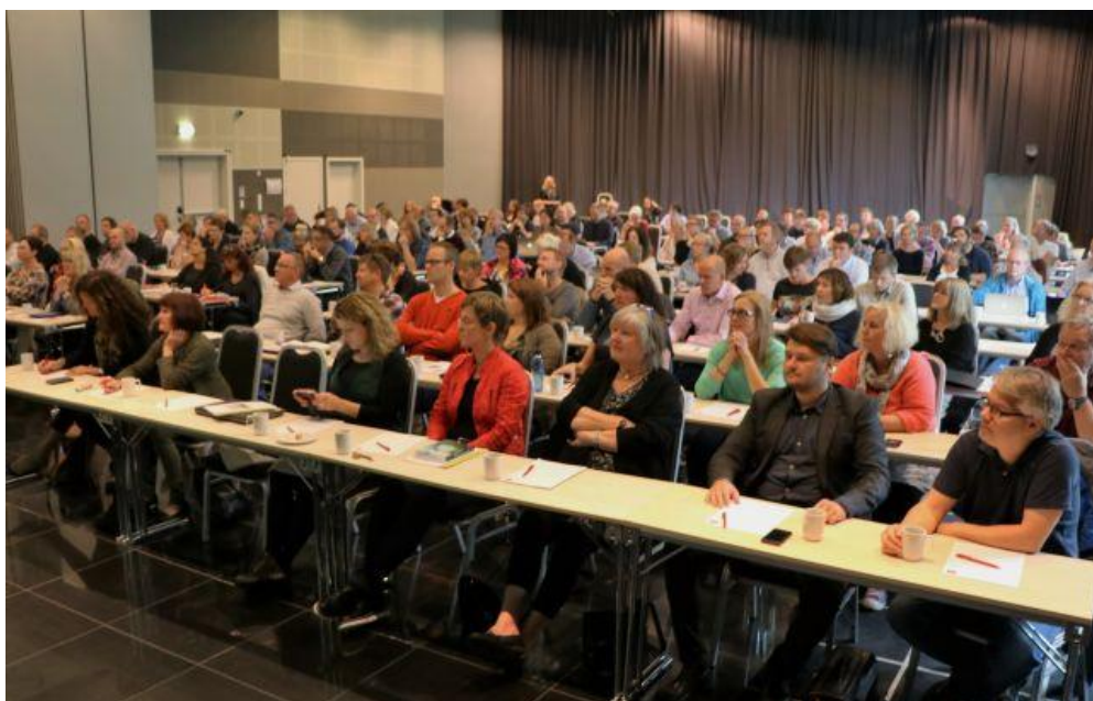
Skoleeiere og ledere fra 51 kommuner på Oppstarts-samling for Veiledning i forbindelse med ny Rammeplan for kulturskolen.

Det finnes noen barn og unge som har bedre forutsetninger enn andre for sin kunstutøvelse. Disse elevene har særlige undervisningsbehov. Det er vesentlig å begynne tidlig med målrettet og systematisk arbeid, hvis man skal kunne utvikle seg som kunstner og nå et høyt nivå. Det må ikke sees som en erstatning for, eller en motsetning til, det å gi et spesielt tilrettelagt undervisningstilbud for barn og unge som har forutsetninger for å begynne tidlig med målrettet og systematisk arbeid for å kunne utvikle seg som utøvere på høyt kunstnerisk nivå. En systematisk tilrettelegging av tilbud også for denne elevgruppen, uavhengig av skolepengefinansiering, er en forutsetning for å oppfylle intensjonen om kulturskole for alle.