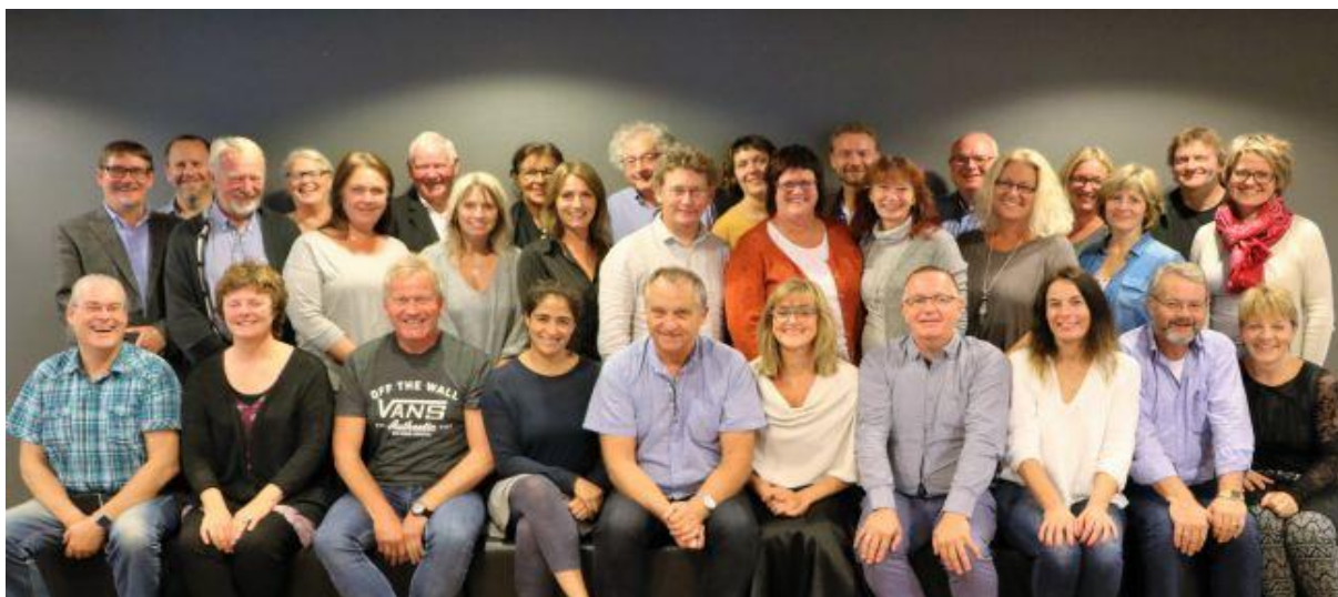
Norsk kulturskoleråds veilederkorps med ressursgruppe fra U/H-sektor.

Det er oppnevnt ei ressursgruppe med fagpersoner fra U/H-sektor til støtte for veilederteamene med kompetanse innenfor prosessledelse, organisasjonsutvikling, endringsledelse, aksjonsforskning og analyseverktøy for å nevne noen av de viktigste områdene. Ressursgruppa ledes av direktør i Norsk kulturskoleråd.