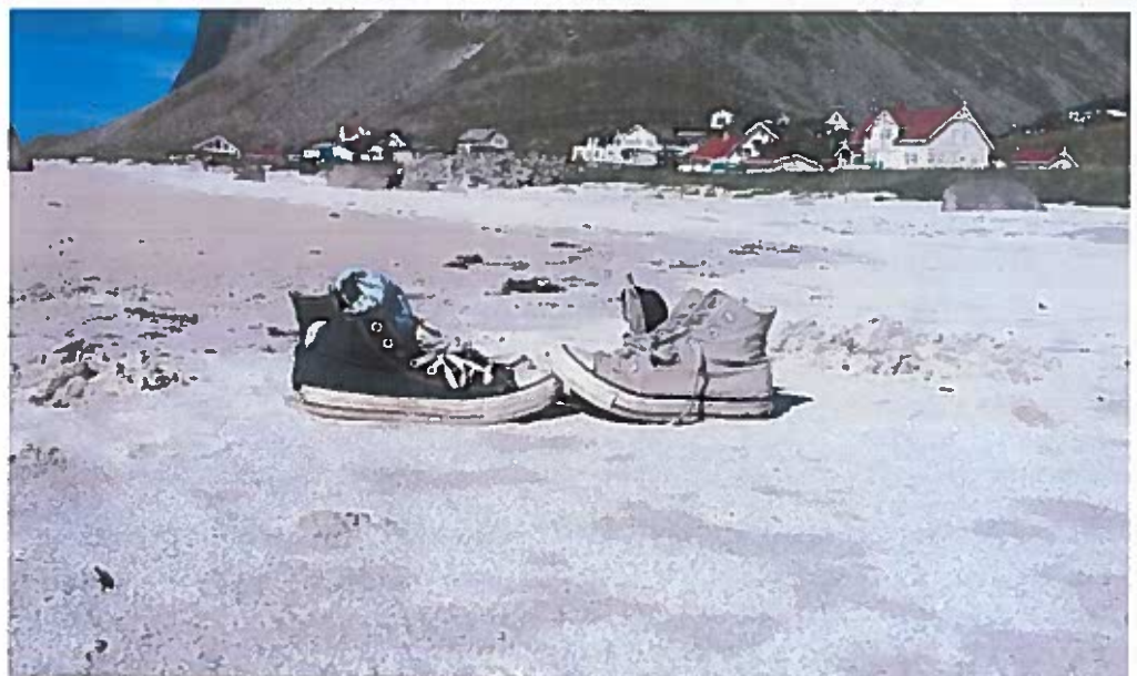
Foto: Sigrid Katrine Thomassen, Kvænangen (Nominert Drømmestipendet 2019)

Kl 16.00 – 19.00 Møterom SAUTSO Norsk kulturskoleråd Troms og Finnmark og Svalbard