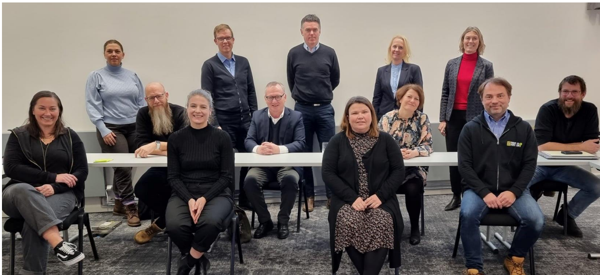
Hovedstyret 3. desember 2021