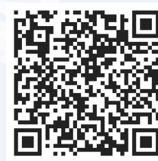
Promovideo av Riis-prosjektet 2022 Filmredigering av Arild Følstad