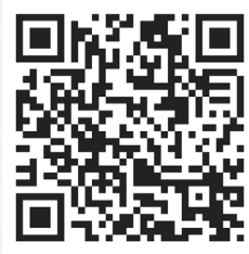
Dokumentasjon av Riis-prosjektet 2022 Filmopptak og redigering av Arild Følstad