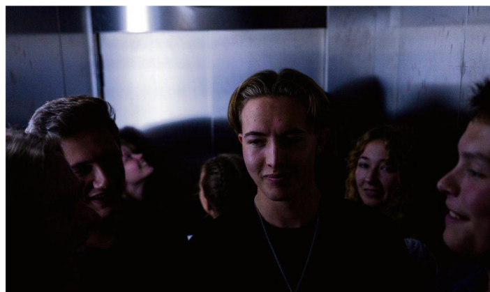
Trengsel i heisen før ungdommen går på scenen.